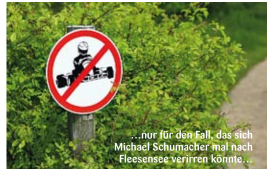
...nur für den Fall, das sich Michael Schumacher mal nach Fleesensee verirren könnte...

Dem Urlaubsgolfer oder Platzreife-Jäger bietet Fleesensee mit dem angesprochenen Axel Lange Generali-Course und den beiden Coca-Cola Courses eine echte Spaßlandschaft ohne großes Frustrationspotenzial. Die neun Par-3-Bahnen des Coca-Cola Family Courses weisen eimergroße Löcher auf, was Anfängern auf Birdie- oder Hole-in-One-Jagd sehr entgegenkommen wird. Sein „großer“ Bruder be-