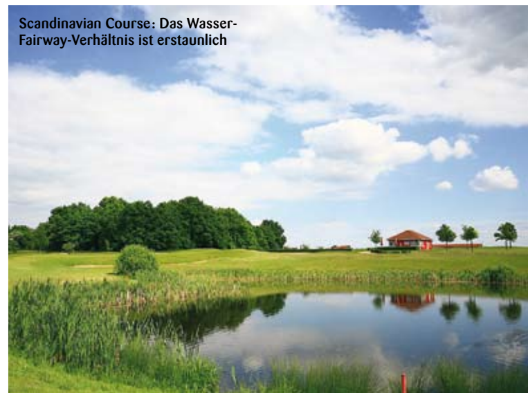
Scandinavian Course: Das Wasser-Fairway-Verhältnis ist erstaunlich