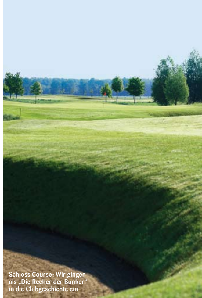
Schloss Course: Wir gingen als „Die Recher der Bunker“ in die Clubgeschichte ein

90 Minuten später stehe ich wieder auf dem ersten Abschlag des Schloss Courses und kann einfach nicht glauben, dass ich erneut in die Fressfalle getappt bin. Ich werde mich über den Koch, der diese unzähligen leckeren Pasta-Variationen zubereitet hat und auch ganz bestimmt kein Italiener ist, offiziell beschweren müssen. Egal, bleibt eben mehr Zeit für das Naturspektakel, in das der Schotte Stan Eby seine Vorstellung von einem Meisterschaftsplatz hineingebaut hat. Doch Vorsicht: Der Schloss Course ist kein Touristen-Wohlfühl-Golfplatz, den bekommt man mit dem „axel lange Generali Course“ (was für ein