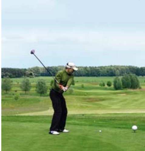
Schloss Course Bahn 2: Ein schmaler, langer Grat mit einem fiesen Grün als Belohnung